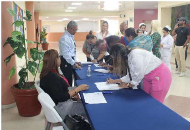
Registro de asistencia