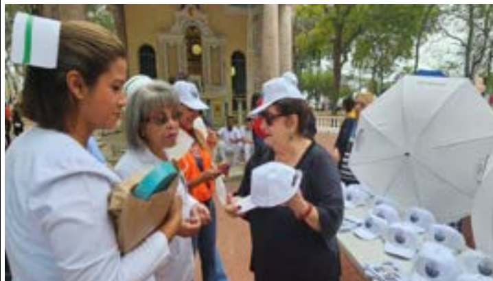
Departamento de Enfermería y RRPP ofrecen gorras y paraguas con logo Centenario.

Colaboradores del hospital y de otras instituciones, jefes médicos, administrativos y de enfermería, estudiantes de universidades, invitados especiales, asistieron y disfrutaron de las actividades: Stand de productos saludables con información nutricional, promoción de servicios de salud, vacunación, toma de presión arterial, peso y talla, punto de venta de frutas y vegetales de Merca Panamá, actividades deportivas, la alegre presentación de la Banda de Música de la Escuela Panamá, etc.