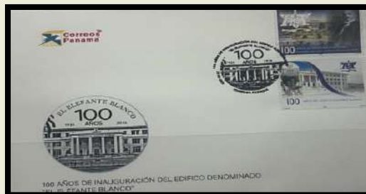
Ejemplar de la Emisión Postal 100 años de inauguración del edificio denominado "El Elefante

En su discurso el DMG, Dr. Elías García Mayorca manifestó que diariamente los miles de pacientes que reciben un servicio de excelencia en el HST, nos dan la satisfacción de haber cumplido con nuestra misión. Agradeció la impresión de estas estampillas con nuestro Elefante Blanco a Correos Panamá y a todos los que posible este proyecto.