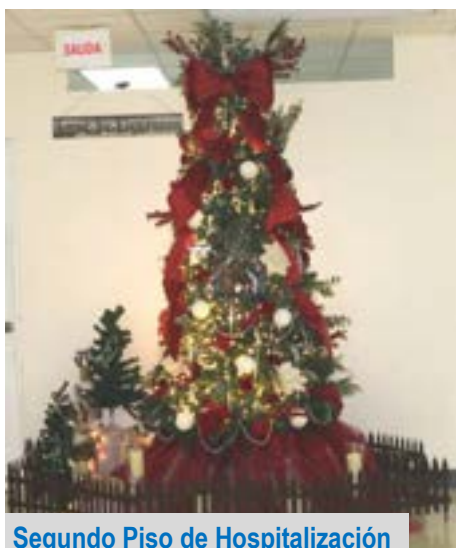
Segundo Piso de Hospitalización