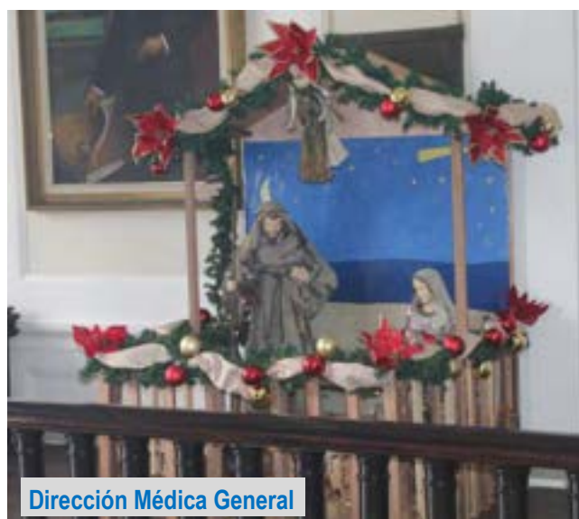
Dirección Médica General